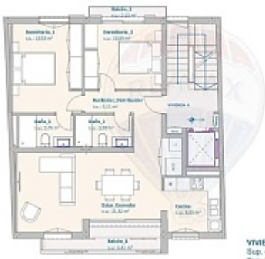
VIVIENDA B. Planta Piso 1 Sup. construida: 83,72 m 2 Sup. balcones: 6,53 m 2